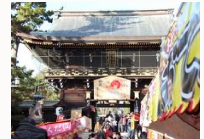
參與在地祭典活動