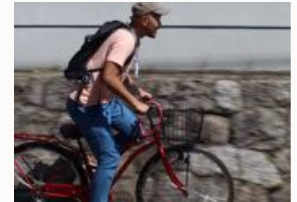
放棄巴士地鐵，以腳踏車移動漫遊京都