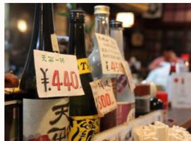
在居酒屋享用晚餐