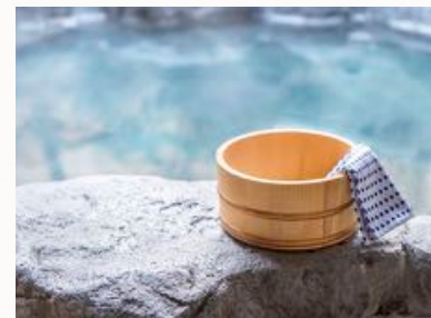
與朋友一起到大眾浴場