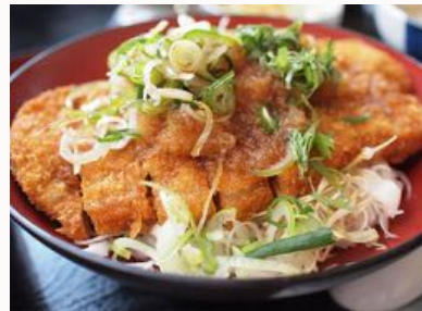
享用高品質的平價午餐