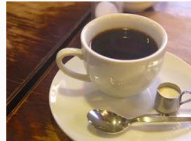
用杯咖啡開始你的早晨吧！